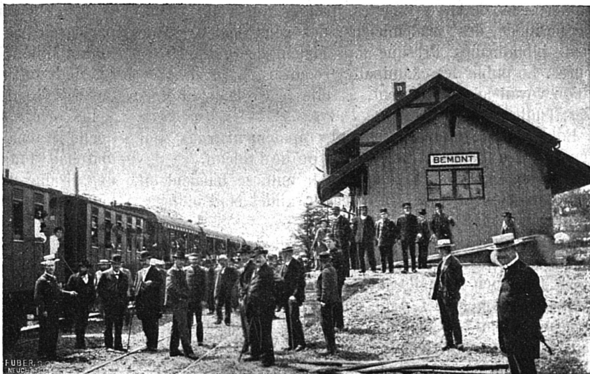
La Station du Bémont

Le 20 mai dernier avait lieu la cérémonie d'inauguration de la nouvelle voie ferrée. Elle eut lieu par un temps