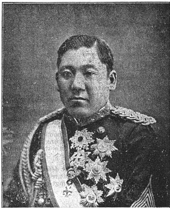
Le marquis Oyama

Il fut longtemps ministre de la guerre au Japon, même ministre de la marine. En 1891 il reprit le service actif. Pendant la guerre sino-japonaise, la deuxième armée fut placée sous ses ordres. C'est lui qui s'empara de Port-Arthur en 1894 et de Wei-Hai-Wei en 1895. C'est à lui que l'on doit aussi le mouvement commun des troupes de terre et de mer pendant cette guerre. Le Moltke japonais, le général Kawakami ayant abdicé son poste en 1899, c'est Oyama, alors marquis et maréchal, qui devint chef de l'état-major général.