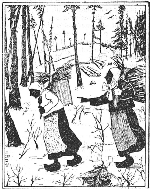
Cherchez les deux gardes forestiers.