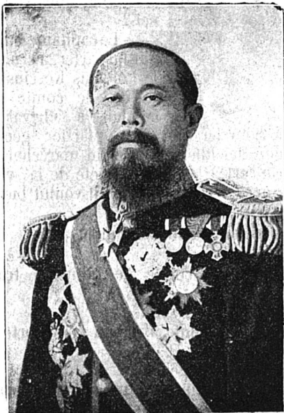
MARQUIS ITO HIRUMBI

Il est le fils d'un paysan. C'est le seul Japonais de haute classe qui ait été l'adversaire de la guerre actuelle, soit qu'il ait eu le pressentiment d'un désastre pour le Japon, soit qu'il fût guidé par un sentiment humanitaire.