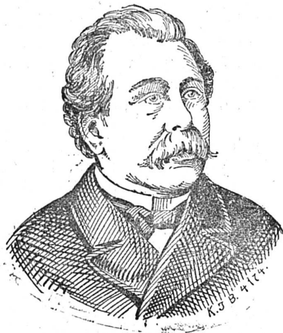
Ministre de Plehwe

Les attentats des anarchistes se multiplient en Russie. Le ministre de l'Intérieur Plehve a été tué par une bombe, le 28 juillet écoulé, alors qu'il se rendait auprès du tsar. Le crime a été commis sur le pont près de la gare Varsovie ; à droite du pont se trouve un restaurant. Un jeune homme qui se trouvait à la fenêtre de l'établissement observait attentivement ce qui se passait dans la rue ; lorsqu'il aperçut la voiture du ministre, il jeta de la fenêtre une bombe qui fit explosion, selon les uns, dans la voiture, selon d'autres, dessous. Le ministre eut la tête emportée et il ne resta de l'équipage que les roues de derrière. Toutes les vitres de la gare volèrent en éclats.