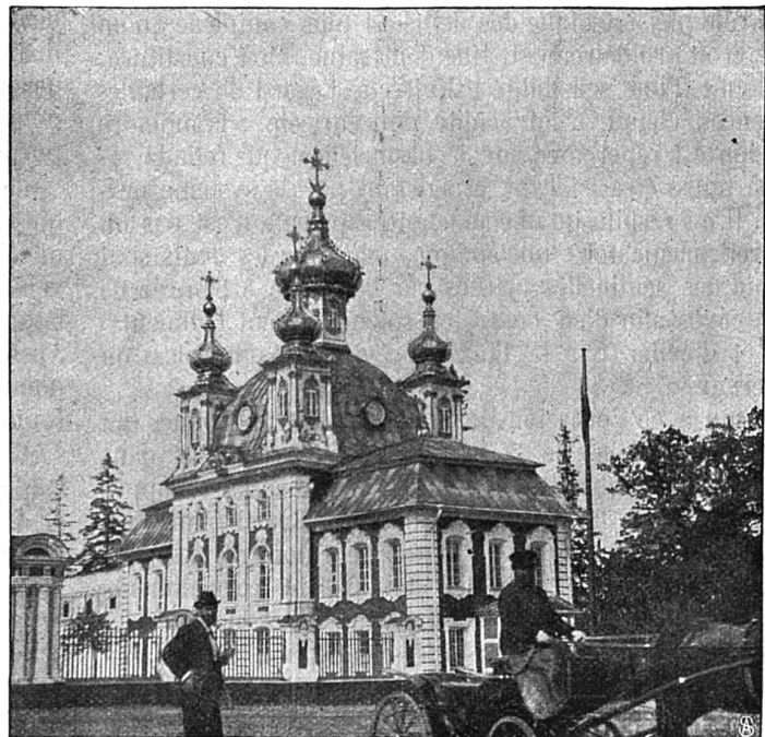
La CHAPELLE DU CHATEAU DU PETERHOF où fut baptisé le prince héritier russe Alexis