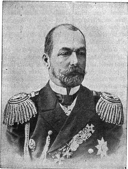
Amiral ROSCHDJESTWENSKY Commandant de la flotte de la Baltique

A peine hors des eaux russes, l'escadre a eu d'autres déboires; et l'on se souvient des démêlés avec l'Angleterre qu'elle a suscités au sujet du bombardement des petits navires de pêche, à 220 milles de l'embouchure de l'„Humber“. Croyant avoir à faire à des torpilleurs japonais, les Russes ouvrirent un feu violent qui coula le „Drane“, en tuant ou blessant plusieurs pêcheurs