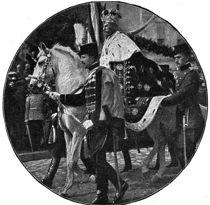
Le roi de Serbie couronné

étrangères qui n'avaient pas voulu, il y a une année, reconnaître tout d'abord Pierre Karageorgewitsch comme roi légitime.