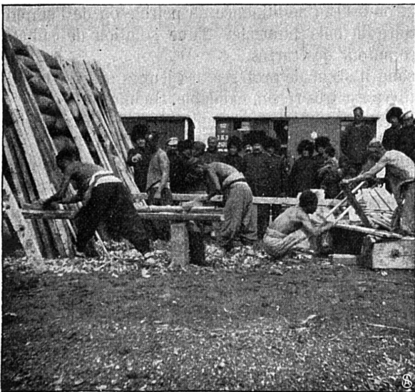
Travaux de défense exécutés par des Chinois sous la surveillance des Russes