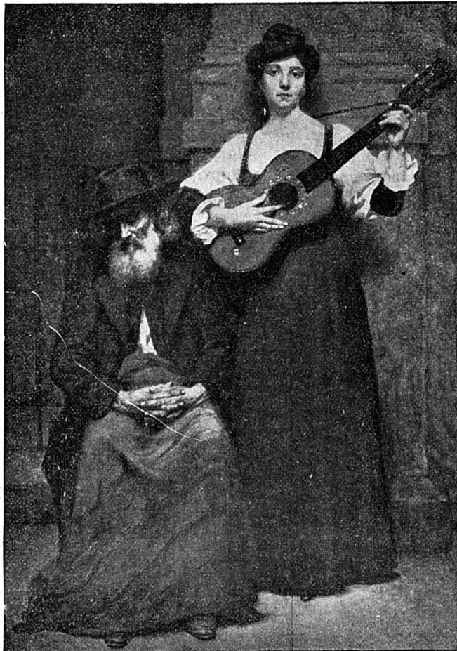
Salon de Paris 1904. L'AVEUGLE, d'après A. Chanut