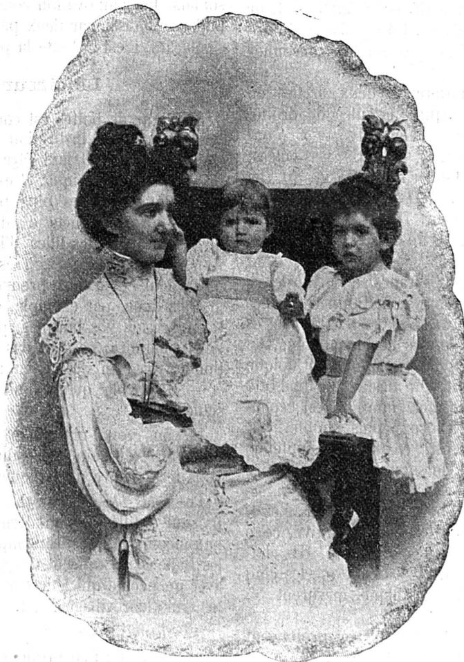
La reine Héléne avec ses deux filles

Le roi d'Italie a épousé Héléne de Monténégro au mois d'octobre 1896. Ce mariage, chose rare dans les familles royales, fut surtout un mariage d'inclination et, plus que cela, un mariage d'amour. De cette union naquit, à Rome, le 1 er juin 1901, la princesse Yolande et, le 19 novembre 1902, également à Rome, est née la princesse Mafalda. Ce sont ces deux enfants royaux que représente la gravure. Bien que le couple royal fût encore jeune, l'opinion publique commençait à s'inquiéter. A défaut d'héritier