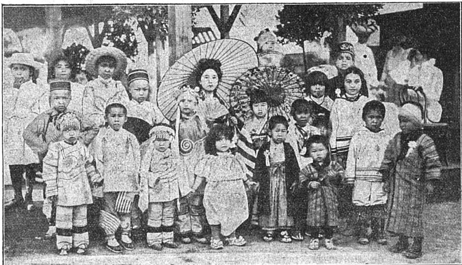
Une fête internationale d'enfants à l'Exposition de Saint-Louis

elles se trouvaient. Plusieurs de ces représentants exotiques étaient venus à St-Louis avec leur famille entière. Ce fut réellement une bonne idée que celle de réunir tous ces enfants si différents de langage et de mœurs, en une fête commune où les jeux et les amusements de toutes sortes ne firent pas défaut, et où les friandises et les rafraîchissements ne furent pas oubliés. Malgré ce contraste étrange de caractères et d'habitude, tout se passa mieux qu'on aurait pu le supposer.