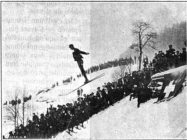
A Glaris (22 janvier 1905) Le norvégien Berg fait un saut de 27 mètres