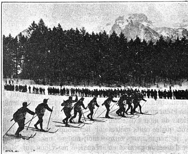
A Glaris (22 janvier 1905) Le départ de la course des sous-officiers et soldats

actuellement les 25 mètres, et le record norvégien est de 35 mètres environ. Que ferons-nous après avoir décrit cette fabuleuse trajectoire ?