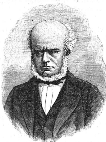
Le peintre Menzel.

Né à Breslau en 1815, il fut à vrai dire son propre maître.