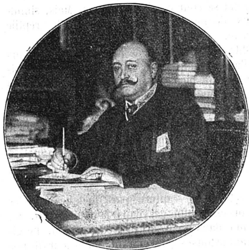
M. François Kossuth dans son cabinet de travail.

Les élections législatives en Autriche-Hongrie, amenant la chute du ministère Tisza et portant un coup terrible au parti libéral, ont mis en relief la personnalité du chef du parti de l'indépendance hongroise François Kossuth.