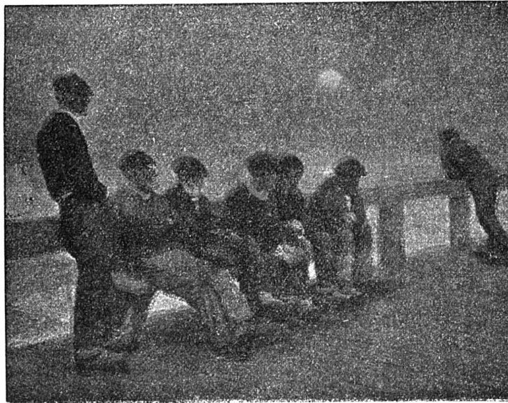
Sardiniers au repos

Une grande vieille se détacha de la foule et mit le pied alertement sur les petits gradins qui menaient à l'inté-