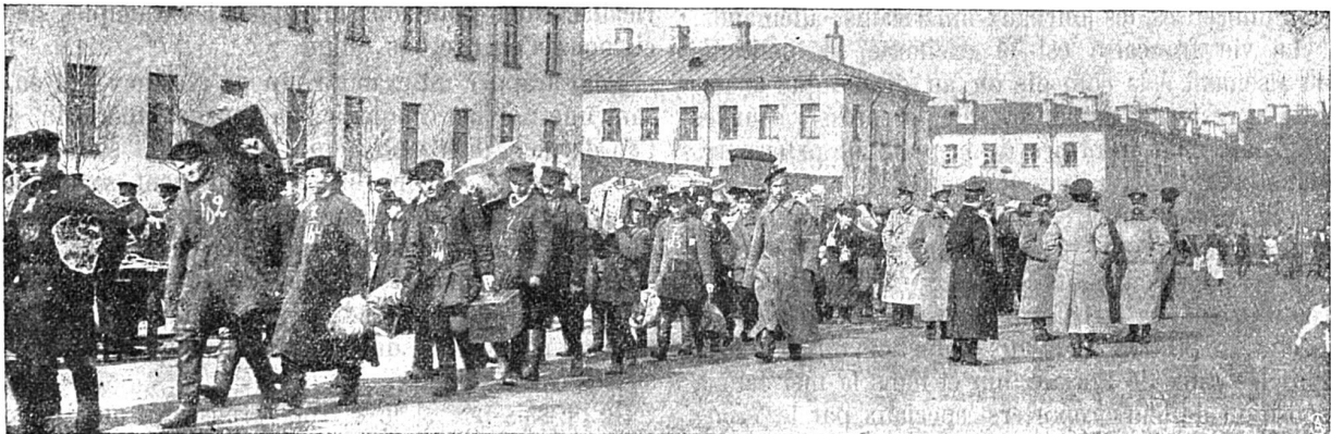
Les levées en Russie. Réservistes se rendant à la gare