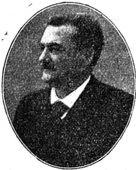
— Le nouveau ministre français de l'Intérieur, M. Etienne.