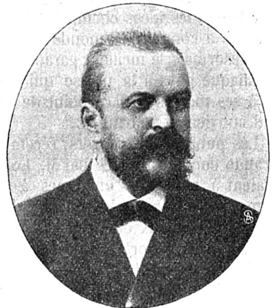
Bulygin, ministre russe de l'Intérieur.

Alexandre Grigorowitch Bulygin est né en 1851 ; il est donc âgé de 54 ans et a fait ses études de droit. En 1859 il fut nommé inspecteur des prisons et plus tard chef général. En 1881, il fut appelé au ministère de l'Intérieur, en 1886, nous le voyons vice-gouverneur de Tambow et en 1887 gouverneur de Kalouga. En 1893, il était nommé gouverneur de Moscou. Il était donc en cette qualité aide du grand-duc Serge et comme ce dernier il était très réactionnaire. Après sa nomination au poste de ministre de l'Intérieur, ses successeurs se rendirent auprès de lui, ainsi que la noblesse de Moscou et d'autres notabilités politiques, pour le féliciter et le remercier de l'équité avec laquelle il avait rempli ses fonctions pendant 11 ans. A cette occasion on lui offrit des icônes. Le ministre déclara qu'il avait été défenseur des lois et qu'il entendait le rester. « Je sais », disait-il, « quelle lourde responsabilité exige mon nouveau ministère, mais je puiserai ma force dans ces saintes images, car tout Moscou est avec moi. »