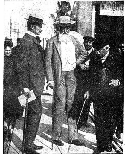
Le roi des Belges à Monaco

L'automobilisme se développe actuellement aussi bien sur mer que sur terre. L'exposition des canots automobiles de Monaco nous en a fourni la preuve et présenté un grand intérêt aux nombreux visiteurs de la petite principauté. Nos gravures nous montrent à côté d'une vue de l'exposition quelques personnages de marque, tels que le prince de Bulgarie, le prince de Monaco et le roi de Belgique.