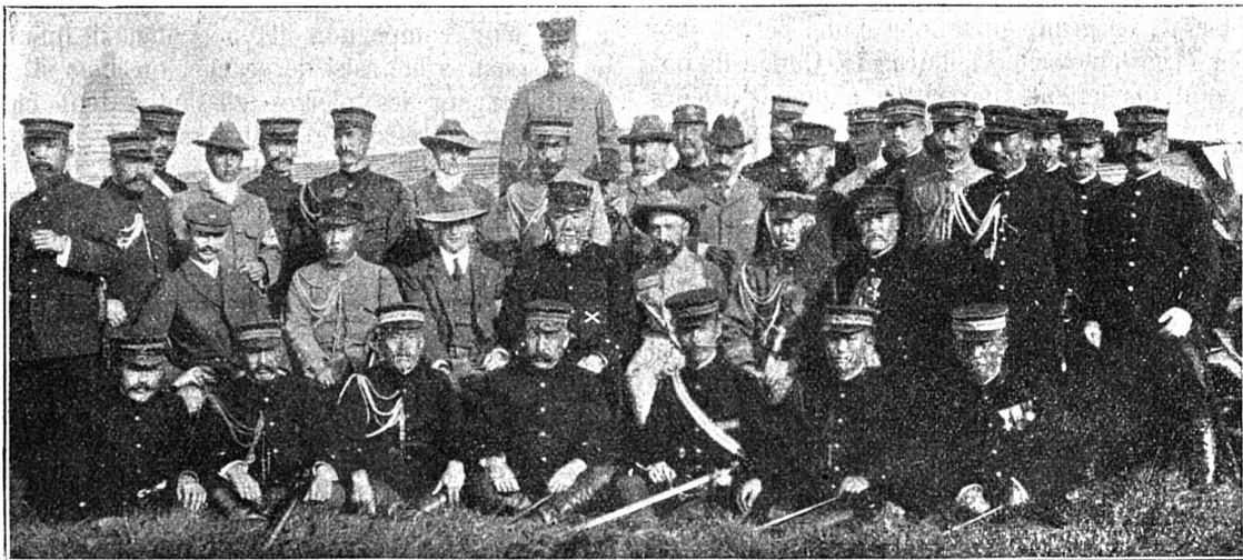
En Mandchourie. — Maréchal Oyama* avec son état-major et les correspondants de la presse

Maréchal Oyama, le victorieux, est né en 1843. C'est lui qui prit une part active à la restauration du Mikado, en 1868, et réprima l'insurrection de Satsouma (1877). En 1880, il devint ministre de la guerre. Il était en France chargé d'une mission d'études militaires, au moment où éclata la guerre franco-allemande de 1870-1871, à laquelle il prit part en se mettant du côté des Français. En 1884 il retourna en Europe pour y étudier l'organisation militaire des différents Etats. Pendant la guerre sino-japonaise, il était commandant du second corps d'armée, et s'empara de Port-Arthur et de Weihaiwei. C'est à lui que revient l'honneur d'avoir su faire