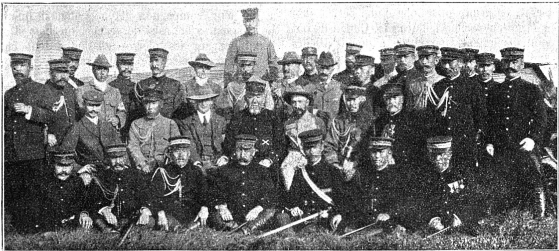
En Mandchourie. — Maréchal Oyama* avec son état-major et les correspondants de la presse

coopérer, dans la guerre actuelle, d'une manière si habile, les forces de terre et de mer. Le plan d'attaque a été conçu par ce stratège renommé.