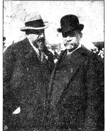
Les princes Ferdinand de Bulgarie et Albert de Monaco assistant à l'ouverture de l'Exposition à Monaco