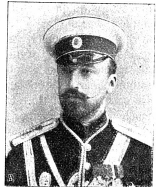
Grand-duc Nicolas Nicolaévitch

Nicolas Nicolaévitch est inspecteur général de la cavalerie. Ce grand-duc est fils d'un frère d'Alexandre II. Nicolas n'a jamais commandé devant l'ennemi et n'a pas eu jusqu'ici l'occasion de montrer ses qualités militaires, mais l'on vante sa décision et la sûreté, la précision, la lucidité avec lesquelles il sait improviser un jugement toujours justes sur les opérations qui viennent de se dérouler.