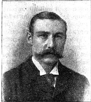
Comte de Selborne

il traita les questions de politique étrangère. Ancien conseiller général de l'Ariège, il se porta comme candidat opportuniste aux élections générales du 22 septembre 1889 dans l'arrondissement de Foix, et fut élu. En 1894, il devint ministre des colonies. Ministre des affaires étrangères depuis 1896, M. Delcassé est auteur du traité anglo-français.