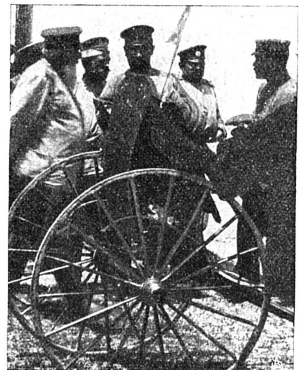
A la gare Takahama