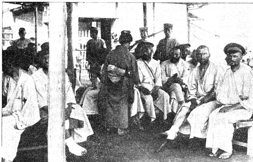
Officiers russes à Matsuyama

Depuis quelque temps les grandes artères de Londres sont sillonnées de gros automobiles-omnibus pratiques, commodes et confortablement aménagés à l'intérieur, avec un éclairage luxueux. Des voitures semblables auraient un emploi tout trouvé non seulement chez nous, mais aussi dans la grande Ville-Lumière où l'on se sert encore dans certains quartiers d'omnibus à traction animale dont le confort laisse beaucoup à désirer.