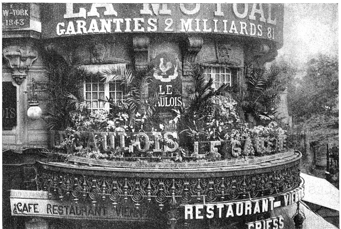
Type de garniture temporaire. — Décoration de la Rotonde du Gaulois.

Il est évident que la décoration permanente des façades pendant la belle saison répond mieux au but visé par les organisateurs que les balcons fleuris superbement pour quelques jours, lesquels n'ont pas de passé et ne sauraient avoir de lendemain. Cependant, cette décoration des quartiers riches peut être rendue permanente par la succession de plantes, au fur et à mesure de leur épanouissement, venant remplacer celles passées et il ne serait pas juste de préconiser exclusivement la parure des fenêtres des jardins ouvriers. Les deux se complètent, car la luxueuse et artistique décoration des hôtels et des maisons élégantes ne peut que développer le goût et faire naître des idées saines et excellentes. On a pu voir notamment dans le quartier de l'Opéra, quels ravissants effets d'ensemble