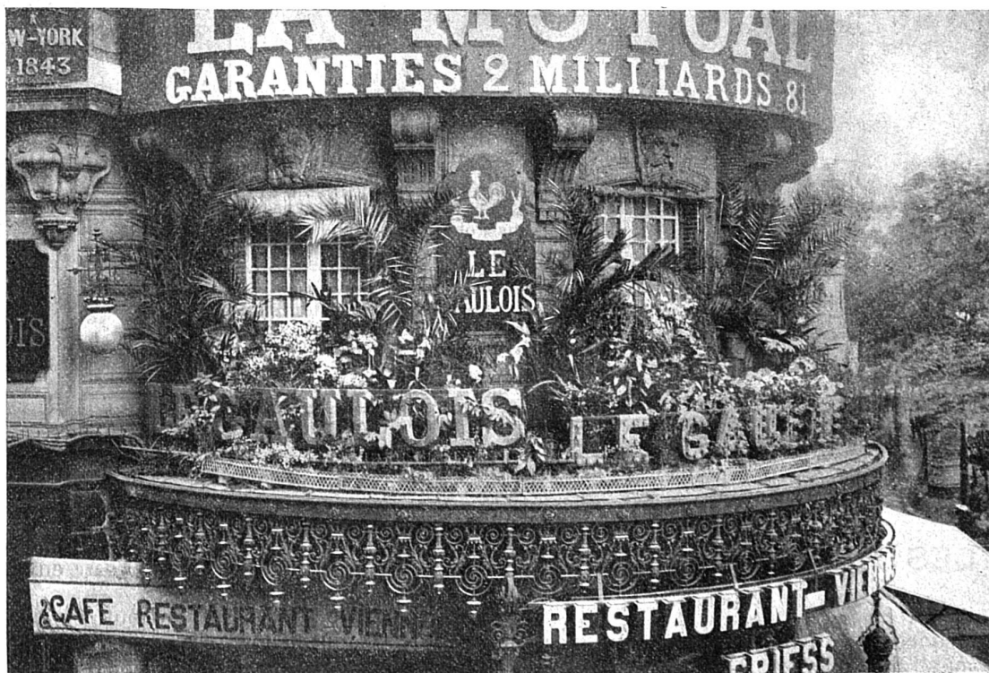
Type de garniture temporaire. — Décoration de la Rotonde du Gaulois.

Il est évident que la décoration permanente des façades pendant la belle saison répond mieux au but visé par les organisateurs que les balcons fleuris superbement pour quelques jours, lesquels n'ont pas de passé et ne sauraient avoir de lendemain. Cependant, cette décoration des quartiers riches peut être rendue permanente par la succession de plantes, au fur et à mesure de leur épanouissement, venant remplacer celles passées et il ne serait pas juste de préconiser exclusivement la parure des fenêtres des jardins ouvriers. Les deux se complètent, car la luxueuse et artistique décoration des hôtels et des maisons élégantes ne peut que développer le goût et faire naître des idées saines et excellentes. On a pu voir notamment dans le quartier de l'Opéra, quels ravissants effets d'ensemble