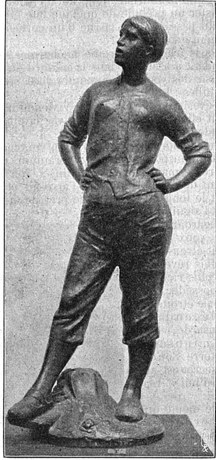
Femme du mineur

Pour compléter cette brève notice sur Meunier et donner au lecteur une idée de l'œuvre grandiose du maître, nous reproduisons ici son « Forgeron » et la « Femme du mineur. »