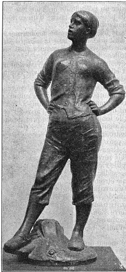
Femme du mineur

Pour compléter cette brève notice sur Meunier et donner au lecteur une idée de l'œuvre grandiose du maître, nous reproduisons ici son « Forgeron » et la « Femme du mineur. »