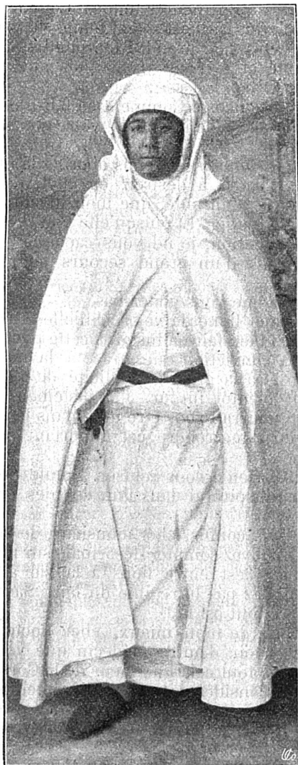
Le sultan Muley Abd-el-Aziz.

le Maroc apprenant en même temps la disparition du défunt chérif et le règne du nouveau.