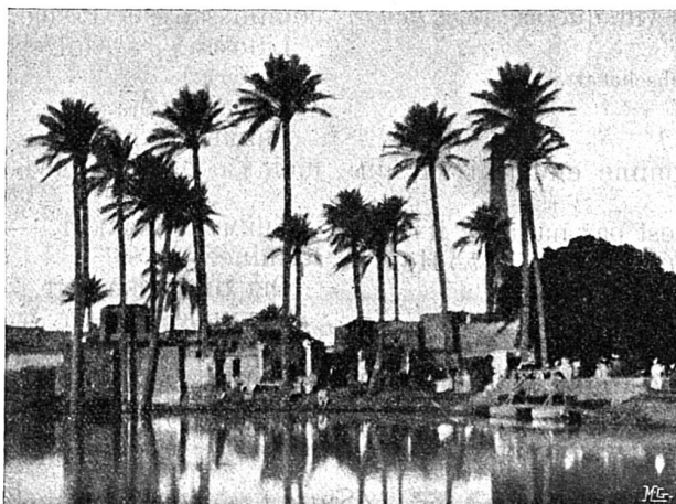
3. Un village arabe dans les environs du Caire.

En partant du Caire avec le tram, on verra le fameux palais d'Ismaïl Pacha, maintenant inhabité. A la station de Ghizé, on pourra se restaurer en un gentil café, construit en partie sur le Nil; de la terrasse on jouit d'une vue magnifique sur le fleuve et le vieux Caire. De là on peut faire une promenade sur le fleuve, soit en prenant le bateau à vapeur, soit en montant sur l'un des nombreux voiliers arabes. A Ghizé se trouvent en outre le Musée, fondé en 1858 à Boulac par Mariette Bey, puis transféré ici en janvier 1882; le jardin zoologi-