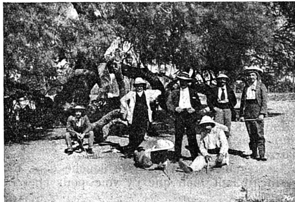
2. Excursions dans les environs du Caire de quelques membres du Cercle suisse.

1. La route des pyramides.—Aujourd'hui, un tramway électrique dont le point de départ est en face de la caserne anglaise va du Caire aux Pyramides. Auparavant, on s'y rendait à dos d'âne ou de cheval, ou en carrosse, car en ces pays chauds, on ne songe pas à marcher; dans le désert, le soleil est si chaud que l'on se brûle effectivement les pieds si l'on