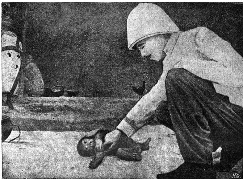
L'auteur avec son chimpanzé à Nyangoué.