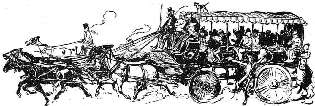
La fièvre des courses à Paris. Un omnibus immense (trainé par 6 chevaux) en route pour le champ de courses.

Bon an mal an, les Français dépensent de cette manière 250 millions, ce qui fait 6 fr. par tête. En réa-