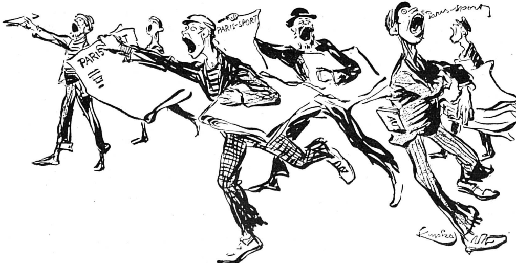
Les vendeurs de journaux sur les boulevards après les courses. Résultat complet des courses. Paris-sport.

L'aristocratie et les gens de haute volée se tiennent