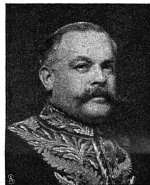
Lowther, ambassadeur anglais à Tanger, envoyé en mission particulière à Fez.

On choisit les plus beaux et les plus sains. On coupe la queue et l'extrémité des feuilles, et on les trempe dans l'eau bouillante assez longtemps pour pouvoir en extraire le foin. Saupoudrez l'intérieur avec du sel et placez-les dans un vase de grès avec de l'eau et une bonne poignée de sel; le lendemain, changez votre eau et faites une saumure plus forte encore avec trois ou quatre poignées de sel et un verre de vinaigre, il est bon de recouvrir la saumure d'une légère couche de beurre fondu ou d'huile, qui, en empêchant le contact de l'air, contribue à la conservation des artichauts. On les fait tremper dans l'eau tiède avant de les manger et l'on a soin de les faire cuire à grande eau pour leur enlever le goût de saumure.