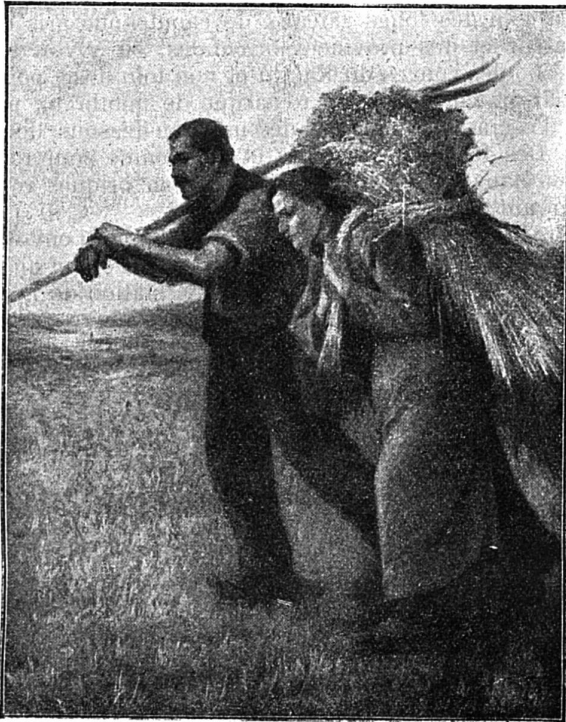
Retour des champs, d'après le tableau de Suzer-Coté.

Ah! le dur labeur des champs, qui demande à la femme autant d'efforts qu'à l'homme, que dis-je, plus d'efforts, puis-