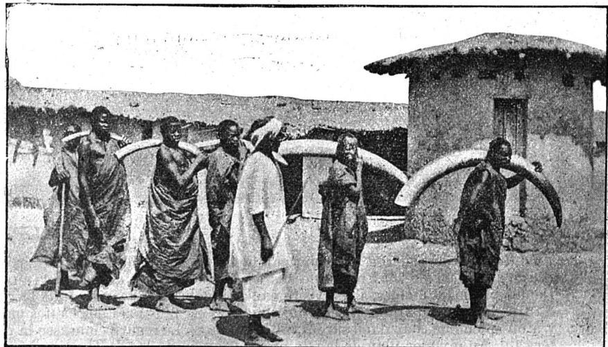
Congolais, porteurs d'ivoire.

Voilà quelques-uns des incidents qui rompent la monotonie des jours de caravane. Après six ou au plus huit heures de marche, on arrive à l'étape où est dressée la tente et où se trouvent déjà les porteurs qui vous ont précédé. La journée, ou plutôt l'après-midi est vite passé: on prépare son dîner, un menu frugal et sain, mais dont les plats se ressemblent souvent d'une façon déplorable: on commence par de la poule et du riz, pour finir par du riz et de la poule. Puis on fait la révision de ses malles ou de ses armes, on va voir la cuisine du campement, on fait la chasse aux antilopes de la brousse d'alentour, les photographes photographient et les entomologues cherchent à enrichir leur collection d'insectes. A 7 h. 30 on va se coucher; un peu tôt peut-être, mais comment remplir sa soirée? On n'a personne à qui causer et les braves noirs sont de peu de ressource pour une conversation, si peu élevée soit-elle. Resté seul, près du feu, on pense au pays et à ceux qu'on a laissés là bas et qu'on ne reverra peut être jamais; les souvenirs vous reviennent en foule et entre deux bouffées de fumée un gros soupir vous échappe. Les noirs, glacés par votre silence, s'étendent lentement dans leurs loques, leurs yeux brillants fixés sur les vôtres. De temps en temps un des mille bruits de la forêt, un cri éloigné, une cadence monotone, chanson de porteur, s'élève.