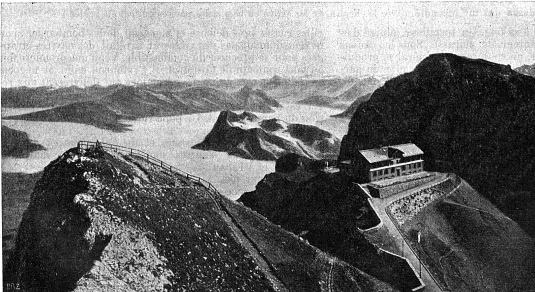
Panorama du Pilate. — Vue sur le lac des Quatre-Cantons, le Rigi, etc

Dans un cas comme dans l'autre, le mot « péquin » aurait donc les origines les plus lointaines.