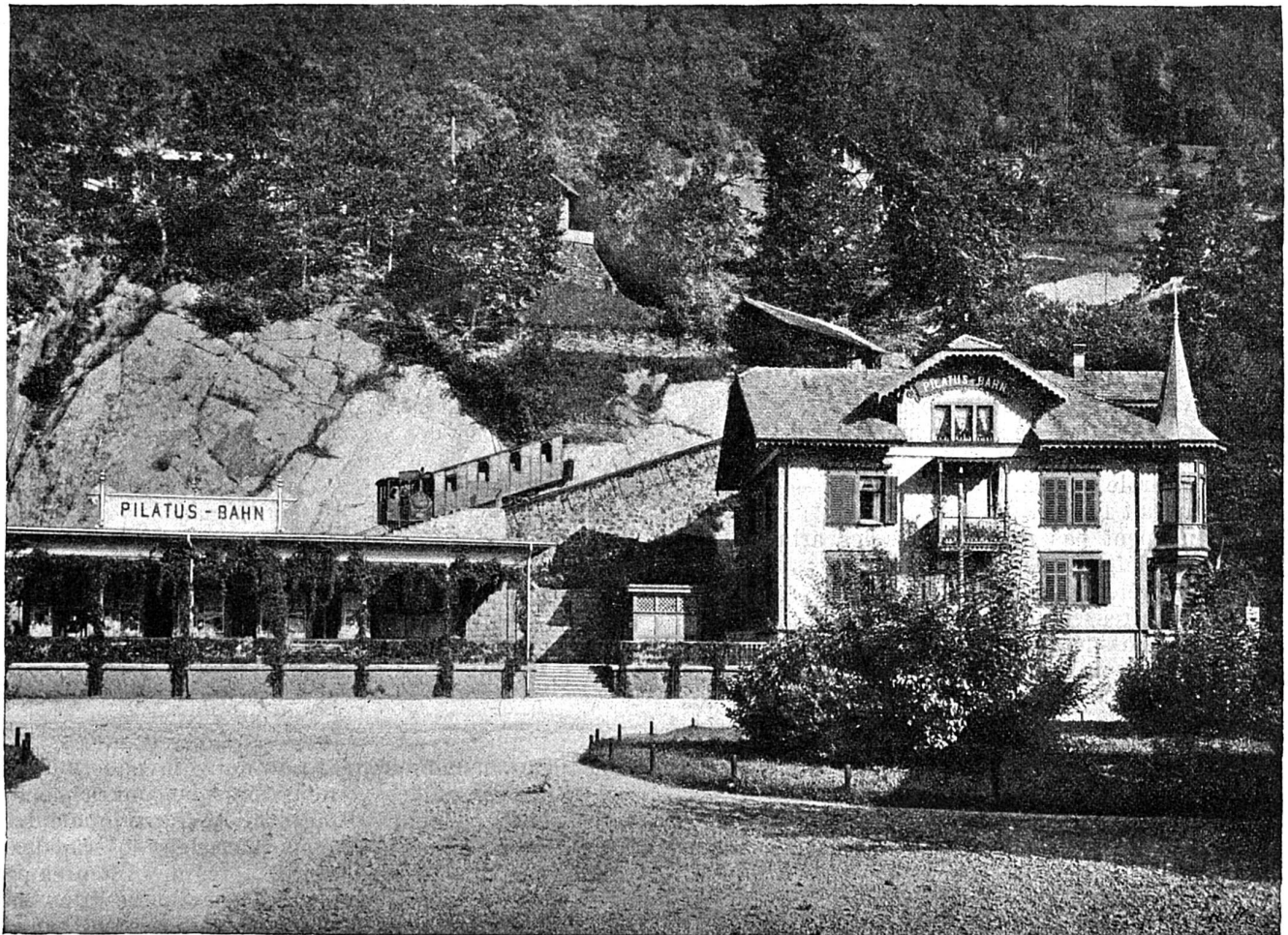
Alpachstad, point de départ du chemin de fer du Pilate.