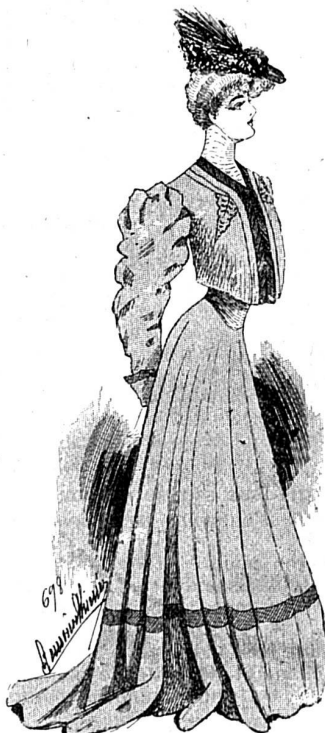
Élégant tailleur. (Fig. 3.)

La ruine est proche pour celui qui gagne au jeu.