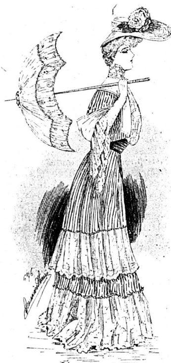
Toilette de Garden-Party. (Fig. 1.)

Ce modèle peut être très joliment reproduit en linon rayé et ajouré, garni de broderie anglaise au lieu d'Alençon; c'est moins chaud pour l'été, moins fragile aussi que la soie et quand