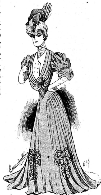
Sur la plage. (Fig. 2.)

Cette robe peut aussi se faire, pour toujours mettre,