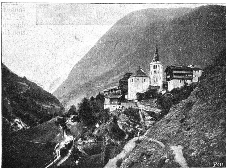
Village de Stalden.

En quittant Saint-Nicolas, la voie traverse un joli vallon cultivé, et bientôt apparaissent au loin les neiges du Breitborn ; à droite le Weisshorn (4513 m) et à gauche les Mischabel . On repasse la Viège avant d'arriver à la halte de Herbrigen . Encore une rampe à crémaillère de près de 2 kilo-