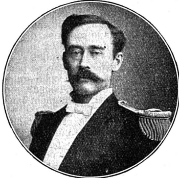
Commandant Robert Peary.