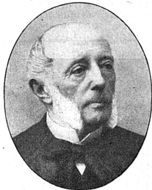
René Goblet, ancien président du conseil.

M. René Goblet est mort le 13 septembre dernier, à Paris, succombant à la crise d'asthme qui l'étreignait cruellement depuis quelques jours.