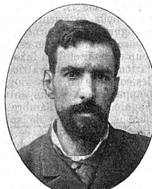
Savorgnan de Brazza.

En 1882, Brazza, épuisé par l'effort donné, rentre en France. L'accueil qu'il reçut fut des plus chaleureux. Les Chambres approuvèrent à l'unanimité, et après des rapports élogieux, le traité Makoko. Le gouvernement prend en mains l'affaire du Congo. Une nouvelle mission, dite « mission de l'Ouest africain », est confiée à de Brazza, qui prend le titre de commissaire du gouvernement de la République dans l'Ouest africain (1883). Pendant trois années (de mars 1883 à décembre 1885), avec ses hardis compagnons de Chavannes, Dolizée, Fourneau, Decazes, son frère, Jacques de Brazza, qui mourut au retour, Potrel, Blom et tant d'autres, il parcourut en tous les sens et fit reconnaître la région comprise entre le Gabon et le Congo, leva le cours du grand fleuve jusqu'à l'Oubanghi et maintint l'occupation française sur les deux rives du Pool. Aussi, le retour de l'explorateur fut-il pour lui l'occasion d'un véritable triomphe, quand, le 21 janvier 1886, au Cirque d'Hiver, des milliers d'auditeurs acclamèrent frénétiquement « le voyageur intrépide qui, avec des moyens restreints et sans verser une goutte de sang, était aller planter le drapeau français sur la route de l'Afrique centrale. »