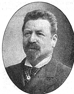
Francesco Tamagno. |

Tamagno fut, peut-être, le plus robuste et le plus brillant des « forts ténors » depuis la disparition des Duprez et autres interprètes de l'ancien répertoire.