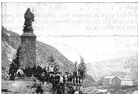
La statue de Saint Bernard au passage du Grand St-Bernard.

muletier. Ce sentier, élargi, a été transformé en route carrossable et les touristes pourront désormais aller en voiture de St-Maurice du Valais (Suisse), à Aoste (Italie), par le col du Grand-St-Bernard, illustré par le passage de Bonaparte et de son armée. En même temps, on a inauguré la statue de saint Bernard qui fonda l'Hospice qui porte son nom, et dont les moines, aidés de leurs chiens, d'une réputation universelle, ont arraché à la mort quantités de malheureux.