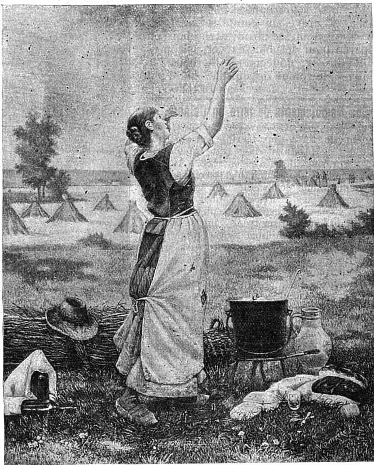
Ohé ! Ohé ! la soupe ! d'après le tableau de E. Ferré.

Oh ! qui dira le regard de lionne meurtrie que jeta