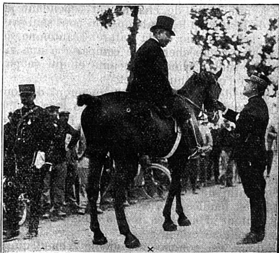
M. Berteaux, ministre de la guerre, aux grandes manœuvres.

Ces grandes manœuvres sont d'une incontestable utilité. Elles seules peuvent permettre l'essai des éléments de la