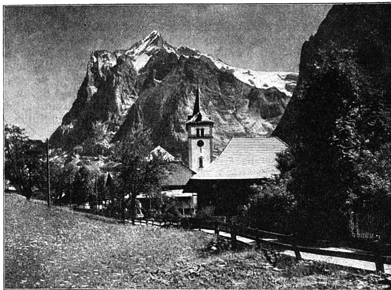
Grindelwald en hiver. — Au premier plan, l'église; au fond, le Wetterhorn.