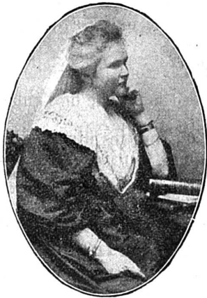
Elisabeth, reine de Roumanie.

Elisabeth, reine de Roumanie, que le monde entier connaît sous son gracieux pseudonyme de Carmen Sylva, est certainement une des physionomies les plus intéressantes et les plus sympathiques parmi les souveraines de notre temps.