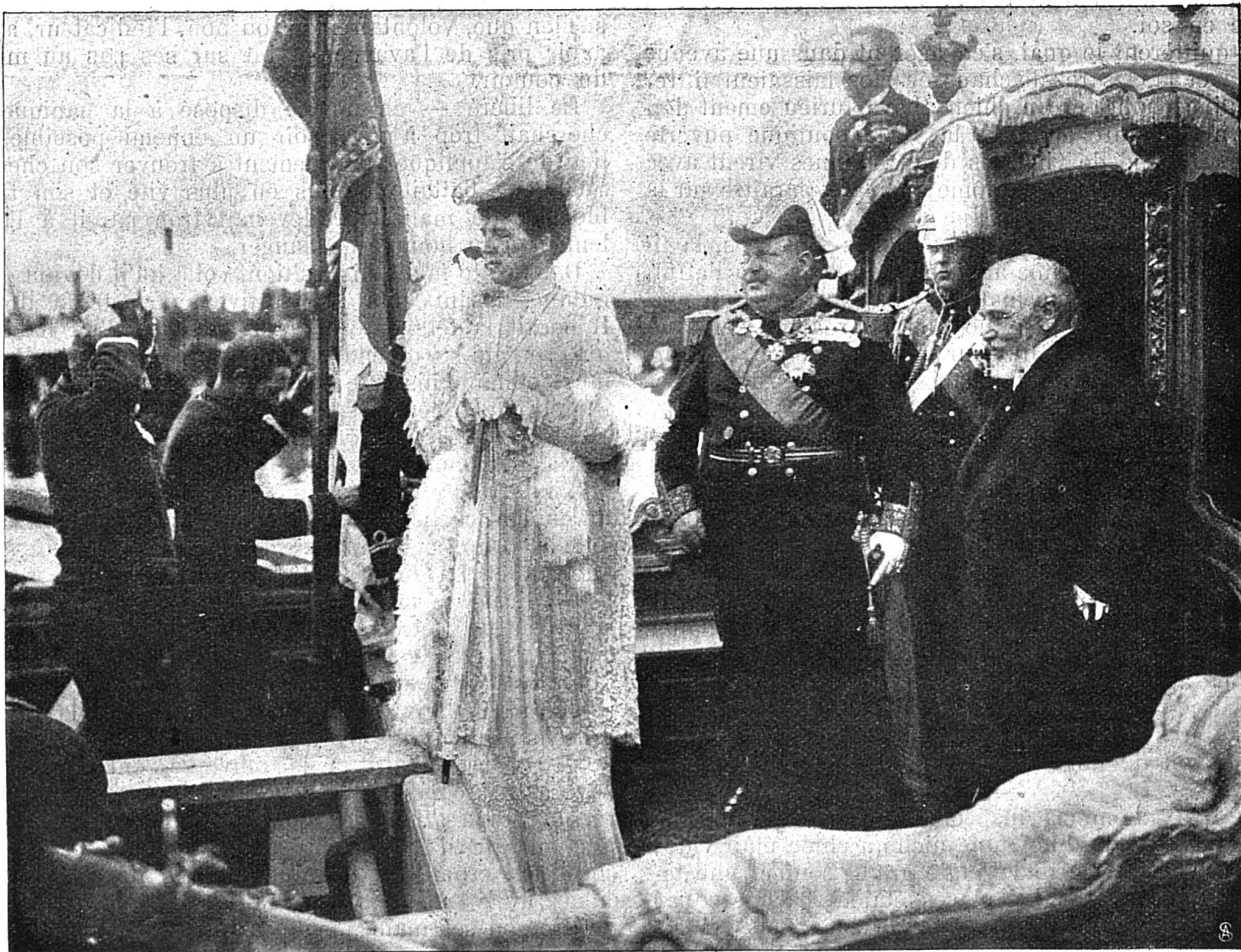
Le président de la république française à Lisbonne. La famille royale et M. Loubet s'embarquent. De gauche à droite : La reine Amélie, le roi Charles, le prince héritier, le président Loubet. (Texte p. 379.)

Aucun passant, aucune voiture n'était en vue. L'hiver rendait ce coin de banlieue absolument désert ; le parapet, les platanes rabougris, les réverbères non