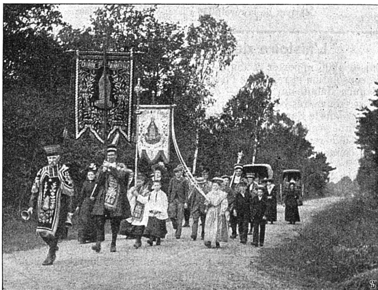
Une charité en pèlerinage.

Lorsque les maladies contagieuses se firent plus rares, les charitons conservèrent néanmoins leurs associations. Ils offrirent et ils offrent encore leurs bons services à tous les malades indigents; ils sont d'un grand secours dans les enterrements. Ils s'occupèrent aussi de l'instruction des enfants; ils accouraient vers les familles affligées par la maladie du père ou de la mère; ils assurèrent l'entretien des vieillards incapables de travailler; ils prirent soin des femmes en couches, donnèrent un trousseau aux jeunes filles et un cadeau de baptême aux enfants. Leur caisse s'ouvrait également pour aider les gens ruinés par l'incendie ou tout autre sinistre.