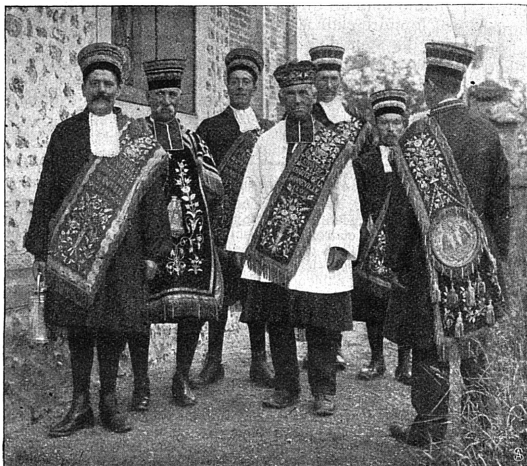
Charitons de Bonneville

La Normandie est l'une des rares provinces de France qui ait conservé jusqu'à nos jours ses anciennes coutumes. Au nombre de ces dernières on peut citer à bon droit les associations nommées « Charités ».