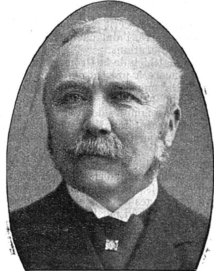
Sir Henry Campbell-Bannerman. Président du ministère anglais.