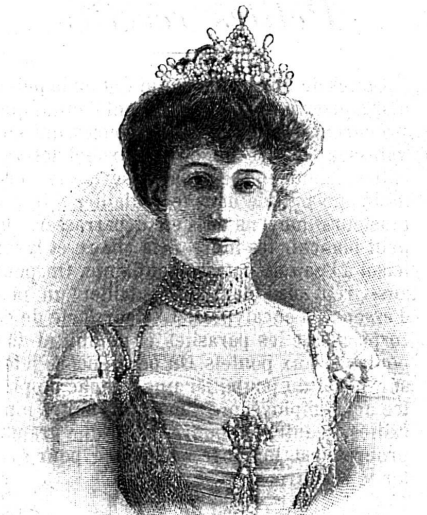
La reine Maud de Norvège.