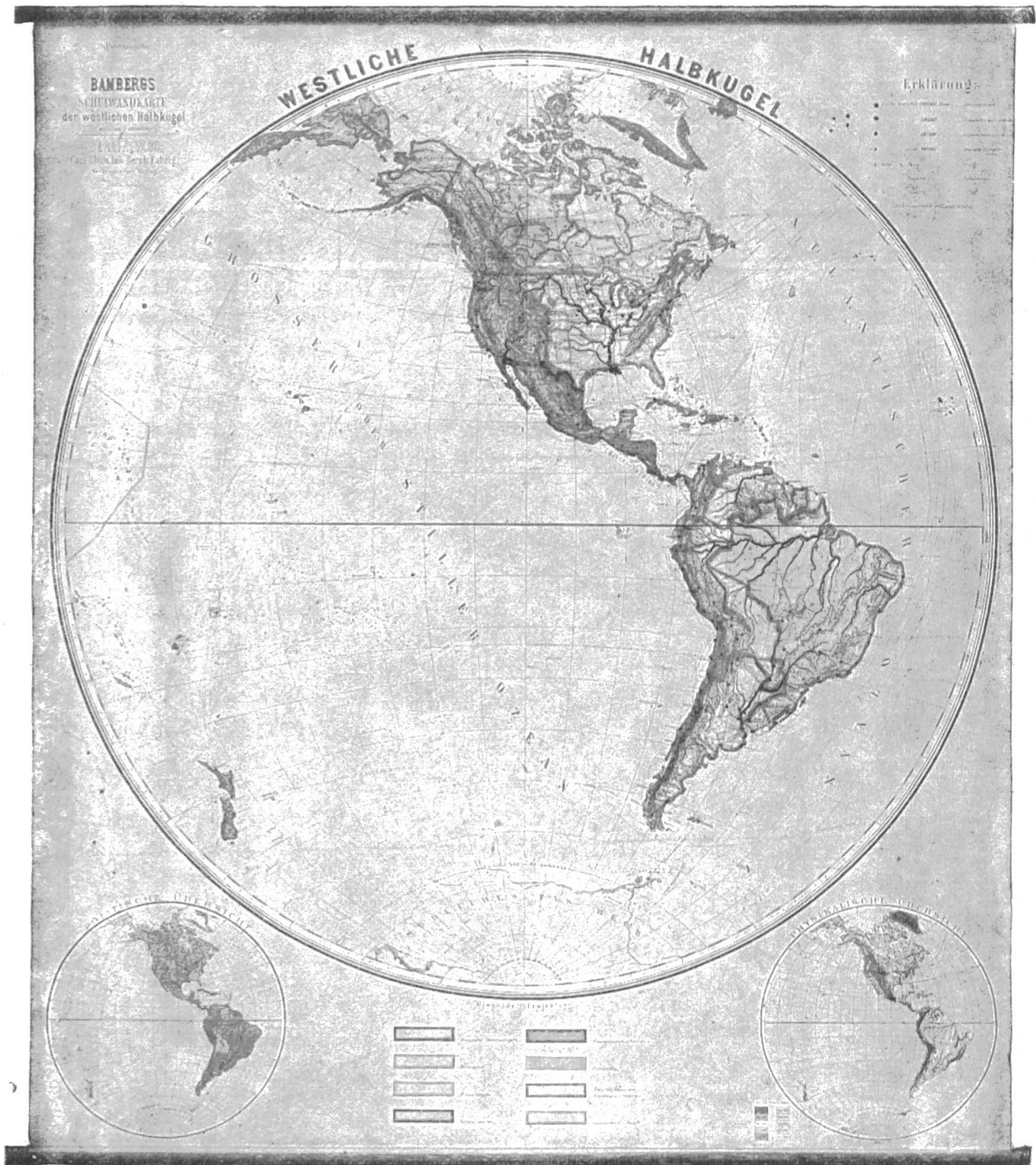
Bamberg, Westlicher Planiglob.