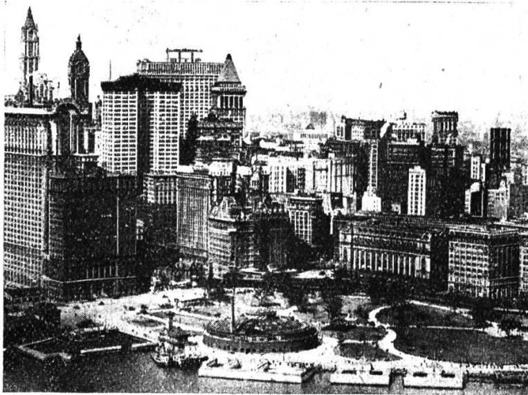
New York, Wolkenkratzer.

Es konnte eine Serie « New York » in unsere Sammlung eingestellt werden, die auf Originalaufnahmen des Herrn E. Ganz in Zürich beruht und ein recht eindrucksvolles Bild der Weltstadt vermittelt. Wir bringen im folgenden das Verzeichnis der Serie (weitere Bilder liefert die Firma Ganz u. Cie., Bahnhofstraße 40, Zürich):