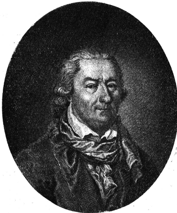
Johann Rudolf Tschiffeli

Inhalt: Johann Rudolf Tschiffeli. — Lavater, Tschiffeli und Pestalozzi. — — Vom Lichtbilderdienst des Pestalozzianums. — Neue Bücher - Bibliothek. — Neue Ausstellungen im Pestalozzianum.