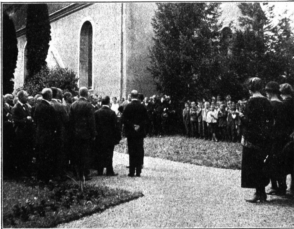
Gedenkfeier ungarischer Lehrer und Lehrerinnen am Grabe Pestalozzis zu Birm (Juli 1925).

Inhalt: Ehrungen Pestalozzis. — Vor hundert Jahren. — Neue Schulbilder. — Ausstellung. — Mitteilung. — Wandbilder. — Neue Bücher - Bibliothek.