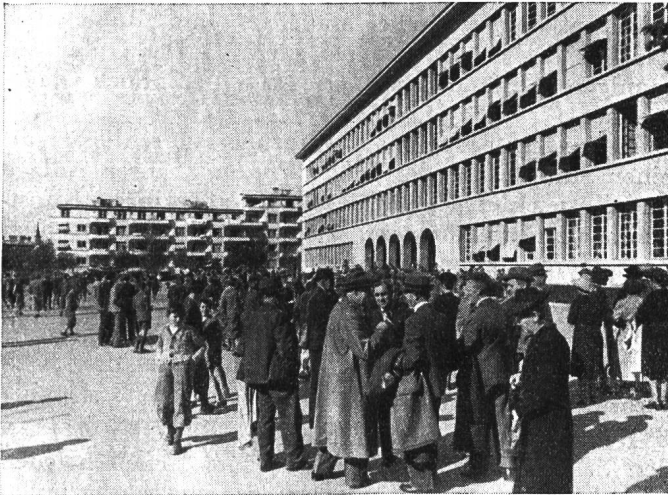
Nach der Turnübung vor der Kantonsschule in Lausanne.

Das beglückende Erlebnis der Tessinertage vom Oktober 1940 hat es ein Jahr später beiden Teilen leicht gemacht: der Leitung des Pestalozzianums, für die Herbstferien 1941 wieder eine Tagung zu planen; manchem Teilnehmer an der Tessinerfahrt, freudig ja zu sagen, als im August ein verlockendes Programm zu einer Reise ins Waadtland einlud. Zwar ist es gegangen wie immer. Neben den Entschlossenen gab es die Zaghafte, die aus dem einen und andern Grund sich erst in letzter Stunde als Mitfahrer meldeten. Dann waren es aber doch nahe an die 90 Namen, welche die Teilnehmerliste füllten, Kolleginnen und Kollegen (zum Teil mit ihren Angehörigen) aus allen Schulstuben im weiten Land. Die Zürcher Gruppe zählte 67 Leute: 38 aus der Stadt, 12 Winterthurer und 17 von der Landschaft; die Thurgauer hatten sich eingestellt (6), und Bern war da (5); St. Gallen stand neben Basel (3 und 2); Aargau, Appenzell und das Tessin meldeten sich mit je einem Vertreter, und selbst ein Altkollege aus Lausanne hatte sich für die Tagung angesagt.