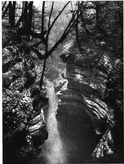
Gorge de l'Areuse