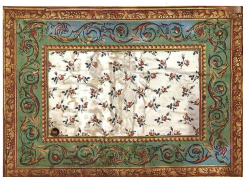
Fig. 41 Frise d'un papier à motifs de draperie, v. 1835.