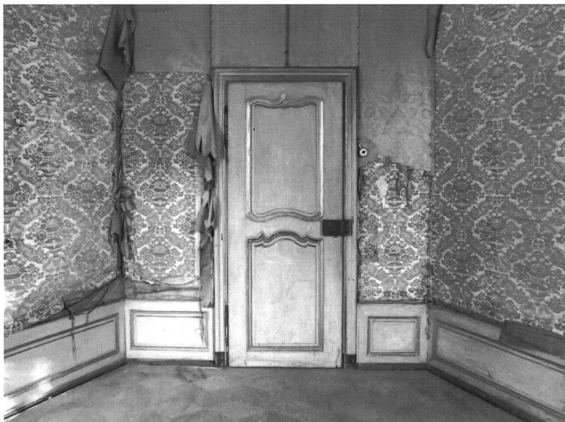
Fig. 35 Papier peint tontisse et lambris Louis XV, peu après 1756

Bien entendu, à côté de cela, nombre de musées d'art décoratif ou de bibliothèques possèdent un fonds, généralement modeste, de papier peint. En Suisse, c'est le cas des musées d'art et d'histoire comme à Genève. Mais, dans ce pays comme dans le cas du National Heritage anglais 11 , les services d'inventaire et de conservation de monuments historiques ont aussi, pour des raisons diverses, collectionné des échantillons plus ou moins importants de papier peint.