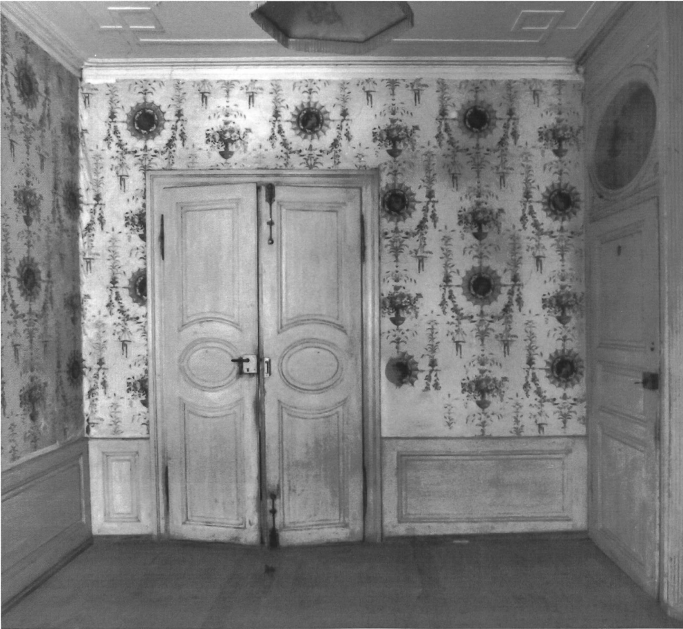
Fig. 42 Paroi sud de la chambre tapissée de papier en arabesques, vers 1789.