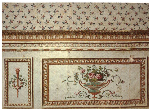
Fig. 38 Détail du papier à l'indienne avec sa bordure après 1781-1782.