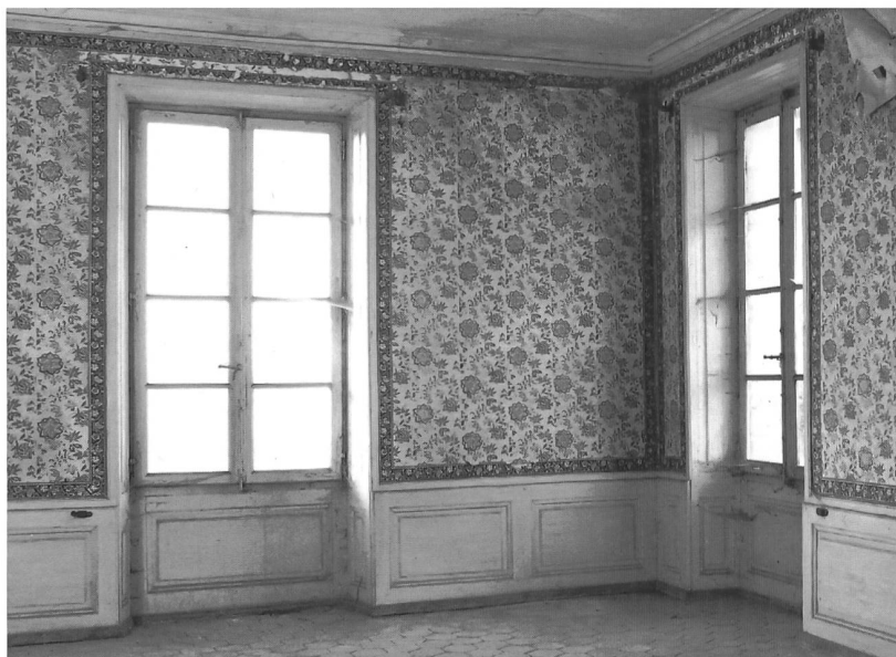
Fig. 36 Chambre tapissée de papier à l'indienne, après 1781-1782.

Constatation fondamentale: dans l'état de nos connaissances, Mézières est un des très rares ensembles de papiers peints de la fin du XVIII e siècle conservé en place. Il est vrai que ceux-ci se comptent sur les doigts d'une main! En Suisse,