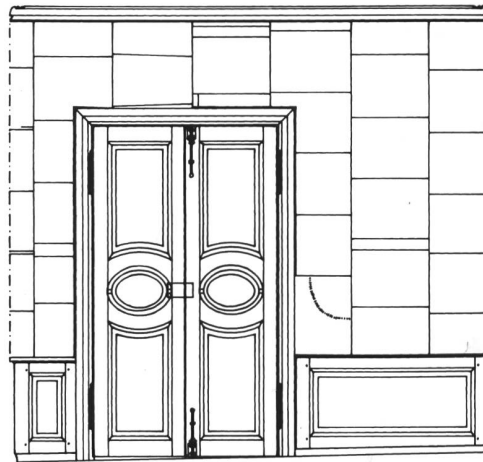
Fig. 43 Relevé de la paroi représentée en fig. 42 avec représentation de la porte, des lambris et des papiers peints.