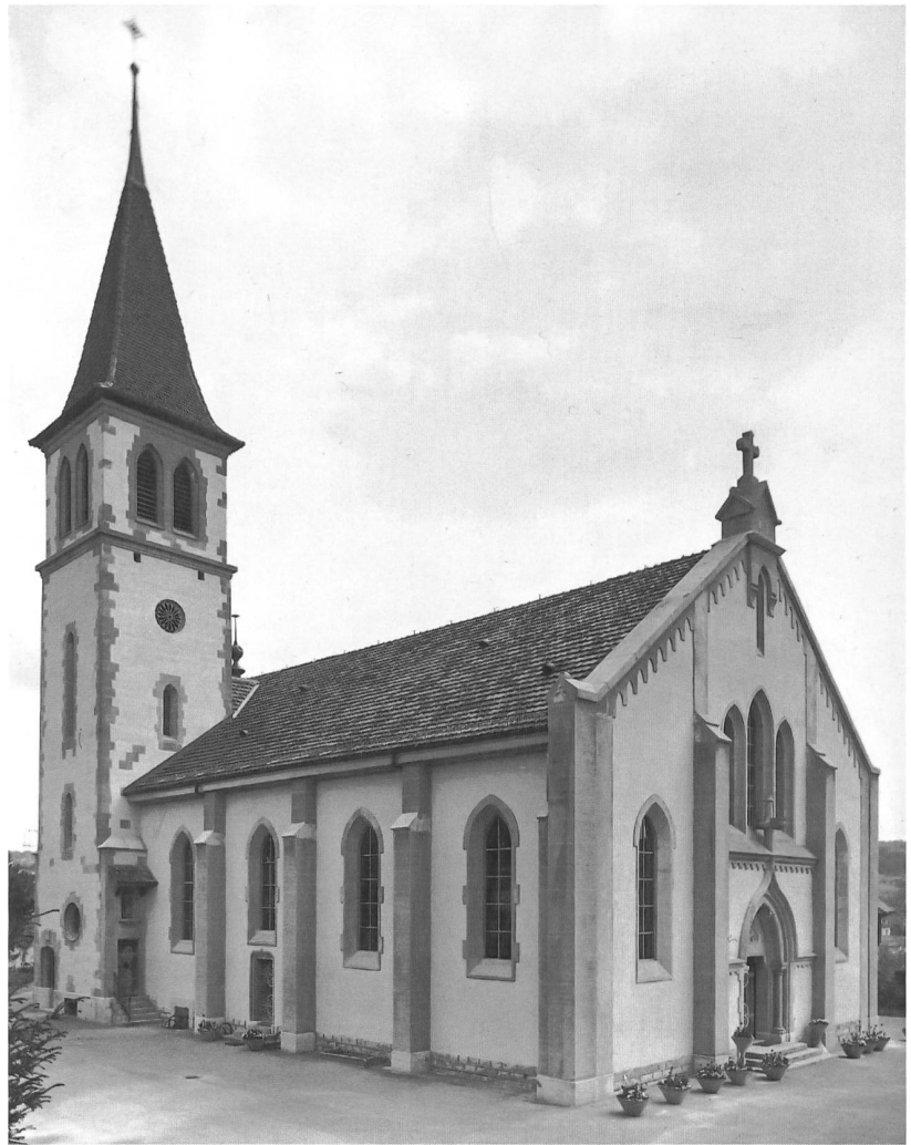
Abb. 3 Murten, Kath. Kirche von 1886/87, Turm 1926. Gesamtaufnahme von Südwesten. Foto 1975.