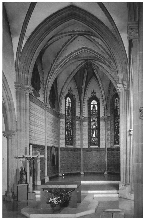
Abb. 4 Murten, Kath. Kirche. Blick in das Chorinnere. Foto 1993.