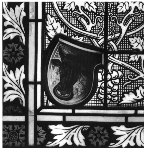
Abb. 8-9 Die Wappenscheiben Bern und Uri aus den ehem. Schiffen (heute im Kirchturm).