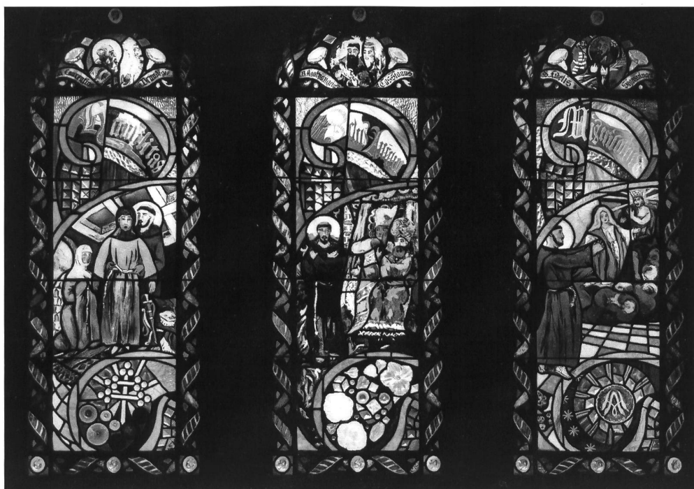
Fig. 11 Alexandre Cingria, Scènes de la vie de saint François d'Assise, vitrail de 1932, créé pour la chapelle du Scolasticat des Capucins de St-Maurice, transféré dans celle du Foyer franciscain après 1939.

7 Praz fait avec Bille les églises de Chamoson (1928-33) et de Fully (1934-36) et Monnier et Chavaz sont engagés par Bille pour l'aider à réaliser les peintures murales de Fully. Sur la position de Bille à l'égard de Cingria, voir MORAND 1994, 32, n. 37.