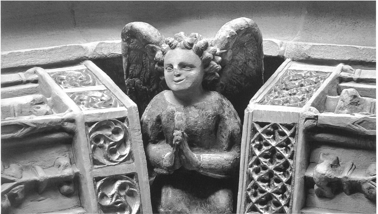
Fig. 94 Angelot en prière, entre les derniers dais de la troisième voussure.