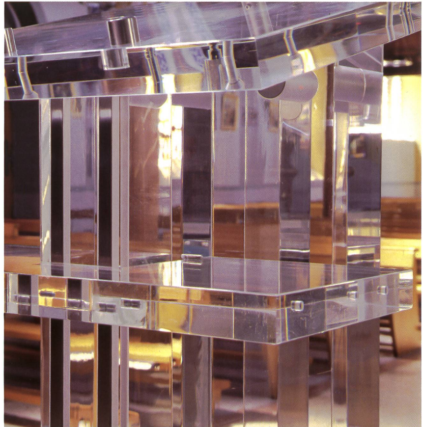
Abb. 6 Detailaufnahme des Lesepults.

Die Transparenz des Acrylglases (Abb. 6) und damit ihres Werkes symbolisiert für Hildegard Tolkmitt das «Nicht-Fassbare» der christlichen Religion. «Das ist legitim, das ist die Entkleidung eines Mythos», sagt sie im Bewusstsein, dass heutzutage Religionen immer stärker hinterfragt werden. In dem lichtdurchlässigen Werk-