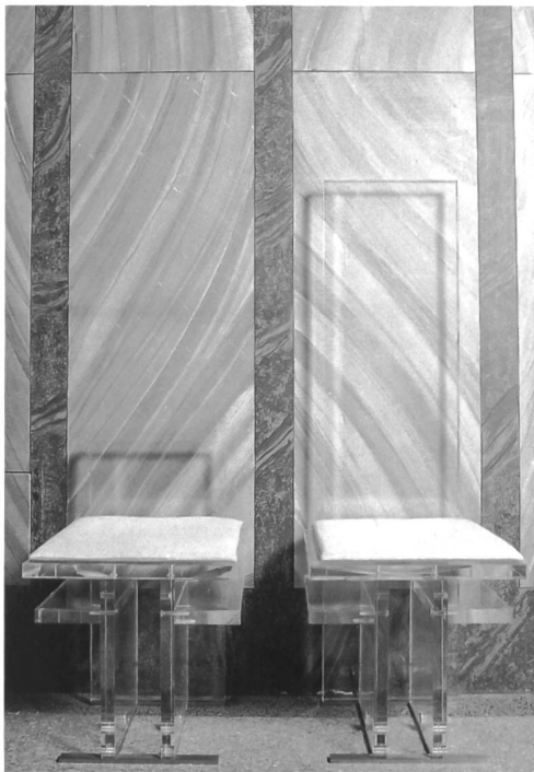
Abb. 2 Die Sedilien.

aufzuweisen hatte. Dabei musste die Wirkung der stark farbigen Innendekoration sowie des bestehenden Hochaltars bei dem neuen Mobiliar einbezogen werden und durfte keinesfalls geschmälert werden. Für den Künstler oder die Künstlerin bedeutete dies, ein Projekt zu entwerfen, das trotz formalen Kriterien und kunstgeschichtlichen Gegebenheiten die Atmosphäre dieses Sakralraumes aufnahm, ihn in seiner Ursprünglichkeit mehr zur Geltung brachte und keinen zusätzlichen optischen Schwerpunkt bilden sollte. In diesem Sinne erarbeitete die Kommission ein Pflichtenheft, das den Künstlern und Künstlerinnen verbindliche Vorgaben zum Entwerfen und Gestalten des Chormobiliars machte, ohne die Entwurfsmöglichkeiten einzuschränken. Eine wichtige Bedingung war die Funktionalität der einzelnen Gegenstände 5 .