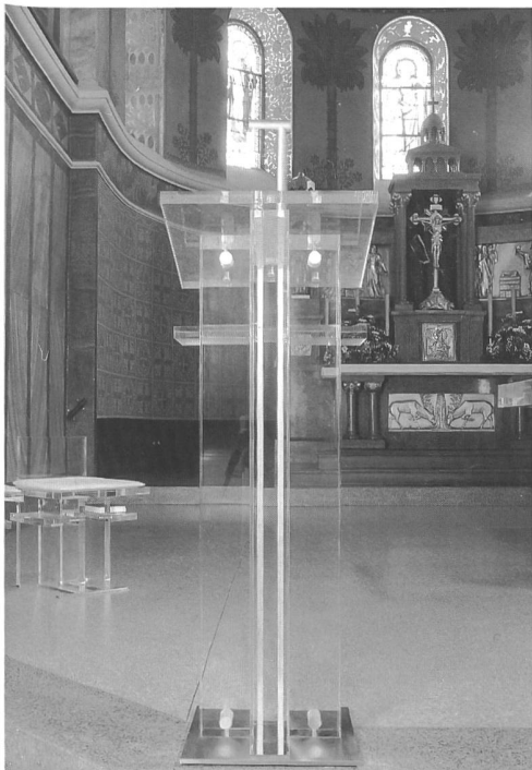
Abb. 4 Das Lesepult.

sen wurden mit Hilfe von kleinen Vierkanthrohren aus Edelstahl auf dieselbe dekorative Art in das Plexiglas eingelegt.