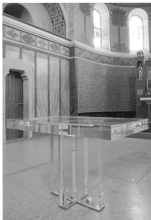
Abb. 5 Der Altar.

Die Sedilien (Abb. 2) bestehen aus zwei vertikalen Standplatten und einer horizontalen Sitzplatte mit kleiner Rückenlehne. Edelstahlstäbe am Boden verbinden die vertikalen Platten und