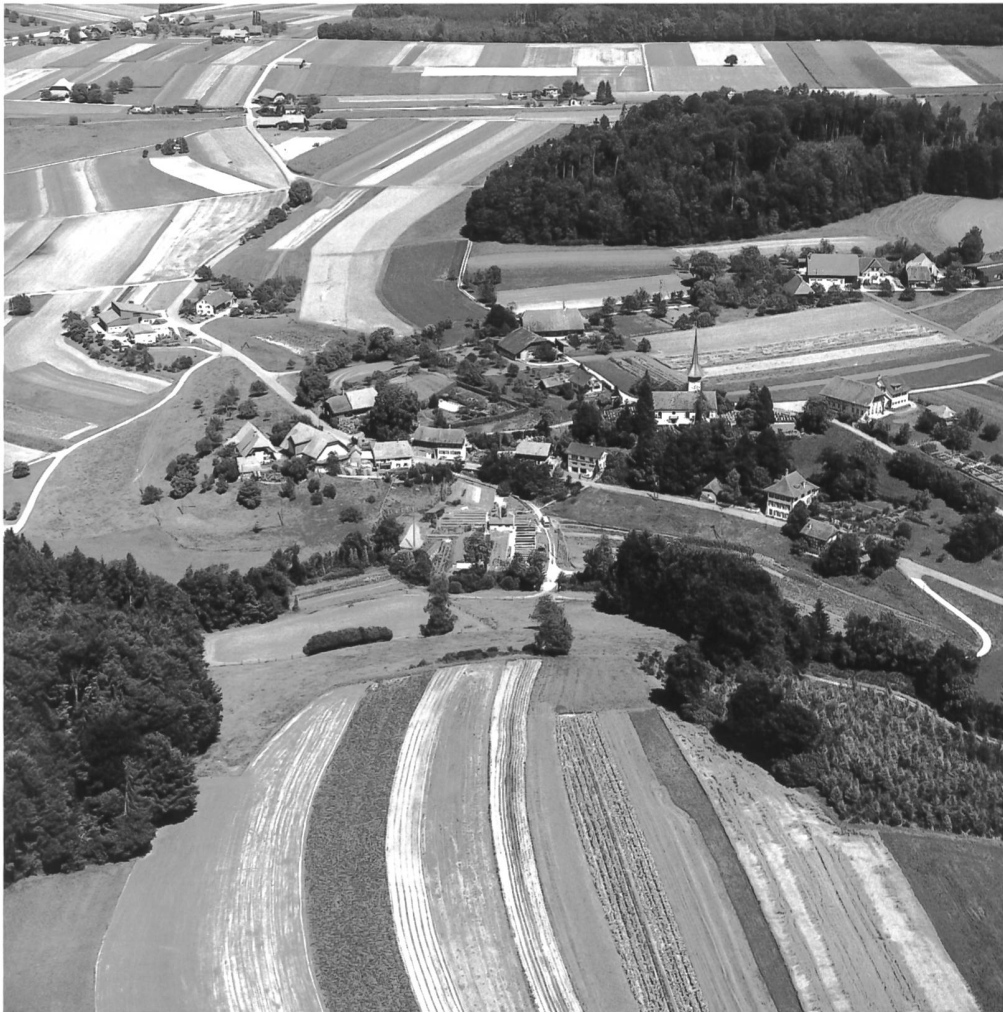
Abb. 1 Ferenbalm 1978, Luftaufnahme von Süden – Der Pfarrweiler, Zentrum der Kirchgemeinde als «Zentraler Ort» unterster Ordnung: Kirche, Pfarrhaus, Schulhaus nebst drei Bauerngehöften, im Hintergrund Einzelhöfe. Oben: Bahnlinie Bern-Neuenburg mit der Haltestelle Ferenbalm-Gurbrü. Meliorierte Flurblöcke, im Vordergrund alte Streifenflur vor der Güterzusammenlegung (Gemeinde Gempenach, diesseits des Grenzbachs der Biberen).

1830er Jahren geschaffenen politischen Gemeinden.