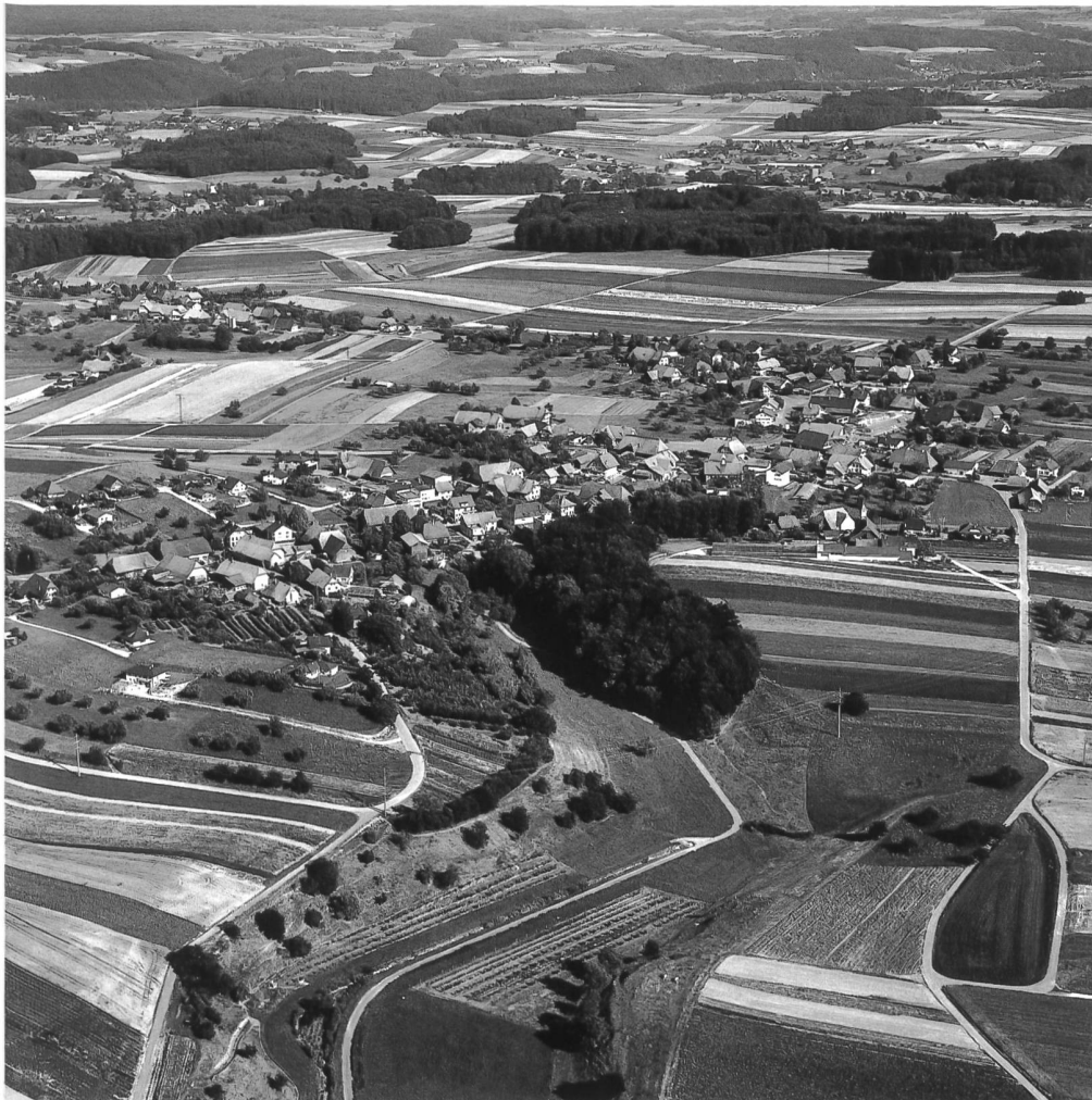
Abb. 2 Ried-Ferenbalm 1982, Luftaufnahme von Nordwesten – Im Vordergrund das langgestreckte Strassendorf Ried bei Kerzers auf einem Sporn des Plateaus über dem Grossen Moos gelegen. Schmale Streifenparzellen für Obst- und Gemüsebau. Im Mittelgrund grossflächige Blockparzellen mit vorwiegendem Ackerbau. Die übrigen Siedlungen sind durch Restbestände der ehemaligen Waldbedeckung voneinander abgetrennt.