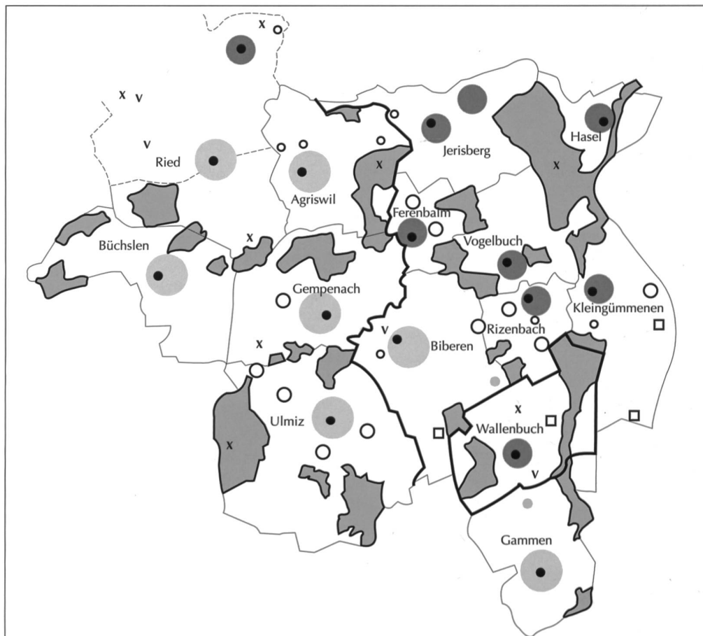
Abb. 3 Kirchgemeinde Ferenbalm, Siedlungsstruktur um 1970

Der Flurplan von 1681 über «Lehen und Dorf- schaft Wallenbuch» ist das älteste Dokument aus dem Gebiet der alten, vor-reformatorischen Pfarrei Ferenbalm, das den Grundbesitz karto- graphisch nachweist (Abb. 4). Die ebenfalls im Staatsarchiv Freiburg erhaltenen Fortsetzungs- pläne aus den drei folgenden Jahrhunderten