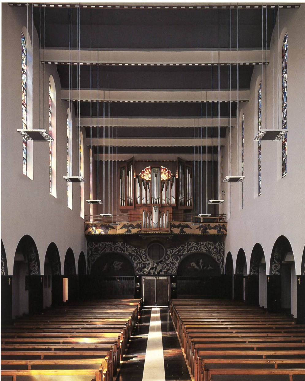
Fig. 148 La nef, avec polychromie reconstituée, de Gino Severini, motifs ornementaux nettoyés, bancs dotés de coussins et perspective des suspensions, état en 2006.

consiste en la mise en place d'un profil situé au plafond derrière l'arc triomphal, dans une position invisible de l'assemblée, où est installée une batterie de projecteurs dotés d'optique cor-