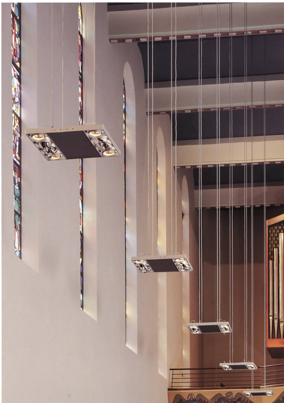
Fig. 146 Les suspensions de la nef, l'un des apports contemporains à la mise en valeur de l'espace et de la lumière.