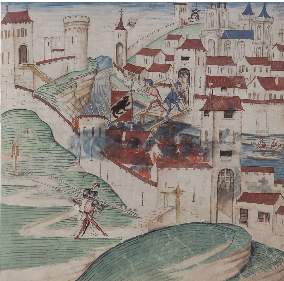
Fig. 19 Les troupes bernoises attaquant Fribourg en 1340 boutent le feu au quartier des Forgerons. Vue idéalisée du chantier de Saint-Nicolas avec la grue sur le clocher, en voie d'achèvement à l'époque de la réalisation de la chronique illustrée de Diebold Schilling. (Amtliche Berner Chronik, 1478-1483, Berner Burgerbibliothek, Mss.h.h.I.1, 139).