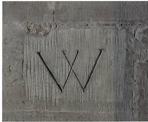
Abb. 95 Buchstabe W zur Bezeichnung einer Grabzeile, Eingangshalle, Südseite, Blendarkaden. Der Quader wurde mit dem Zahneisen vorbereitet.